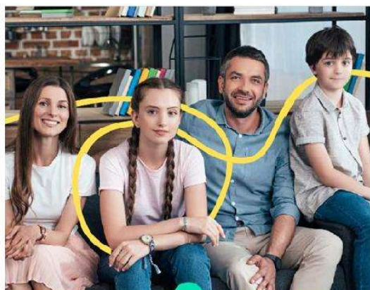
Accueillir un lycéen étranger en famille